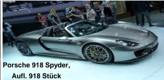
Porsche 918 Spyder, Aufl. 918 Stück