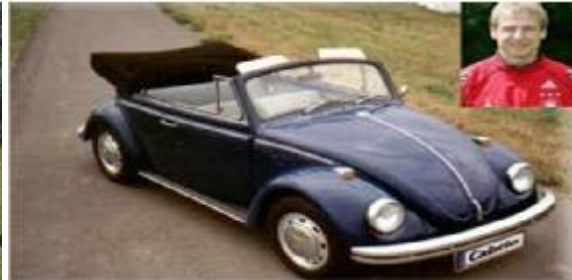
Fahrzeuge mit Historie oder Vorbesitzer