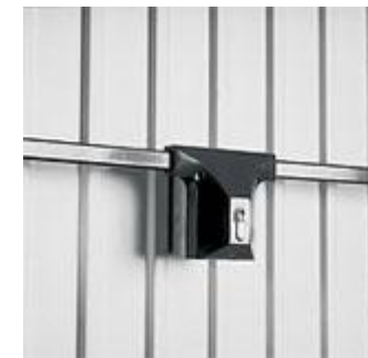
IKON Garagen-Stangenschloss 9M31