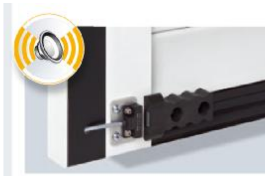
Hörmann akustischer Alarmgeber

ABER: Ab einer Versicherungssumme von 500.000 EUR sollte eine Einbruchmeldeanlage vorhanden sein. Ab einer Versicherungssumme von 1 Mio. EUR sollte eine BMA vorhanden sein.